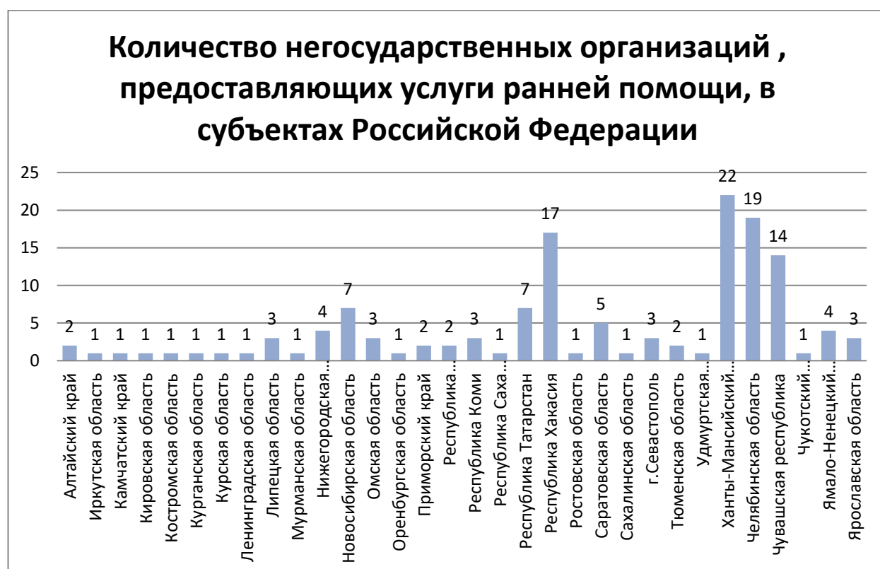
Рисунок 5. Количество негосударственных организаций, предоставляющих услуги ранней помощи, в субъектах Российской Федерации

Распределение субъектов Российской Федерации по количеству негосударственных организаций, предоставляющих услуги ранней помощи, показано на рисунке 5.