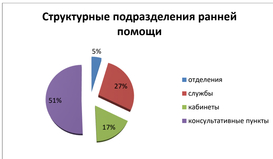
Рисунок 3. Структурные подразделения ранней помощи

Количество государственных (федеральных, региональных, муниципальных) организаций, на базе которых созданы структурные подразделения ранней помощи, распределились следующим образом: