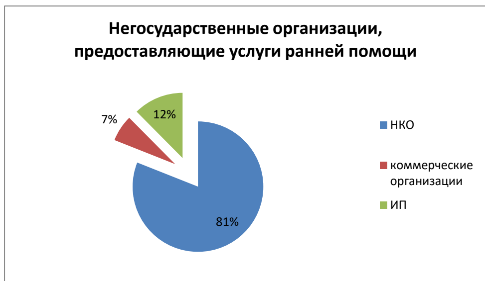
Рисунок 4. Негосударственные организации, предоставляющие услуги ранней помощи

Распределение негосударственных организаций, предоставляющих услуги ранней помощи показано на рисунке 4.